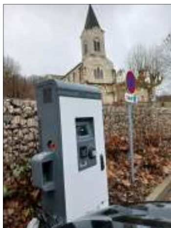
Borne de recharge des véhicules électriques