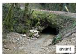
Réparation du Pont du Gar (Chemin du Dévorais)