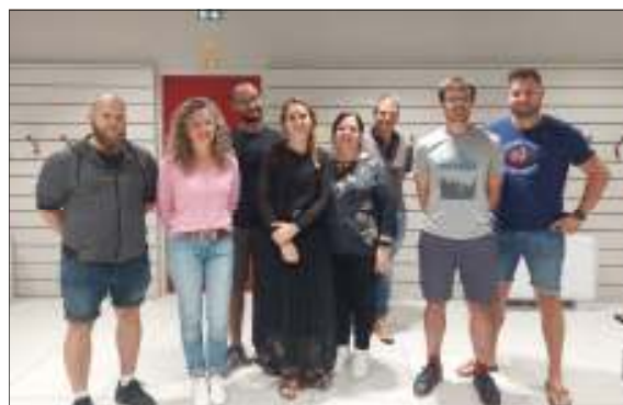
La nouvelle équipe du Sou