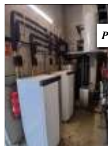
Pompes à chaleur