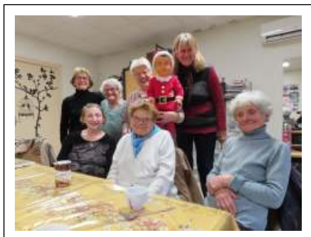
Club de la Babillière

■ Renseignements : 06.68.87.79.95 / 06.29.69.18.14.