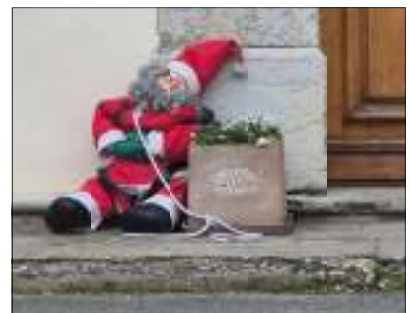
Il est bien fatigué, il a beaucoup travaillé !