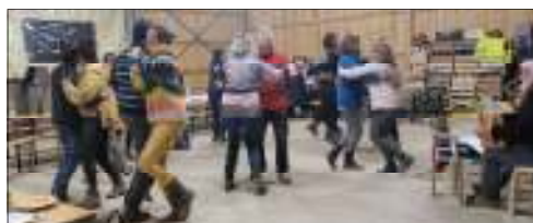
Journée de Ferme en Ferme