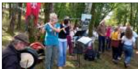
Château de St Germain