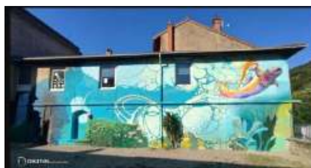
Fresque réalisée à St-Rambert-en-Bugey

Les habitants participent à toutes les phases de création, sous la direction des artistes muralistes associés au projet. Une douzaine de personnes se sont inscrites auprès de la mairie et vu les nombreuses idées et la motivation des personnes présentes lors de la réunion de présentation, la commune espère vivement être sélectionnée pour l'élaboration de cette fresque qui viendrait décorer le mur intérieur du préau de la cantine.