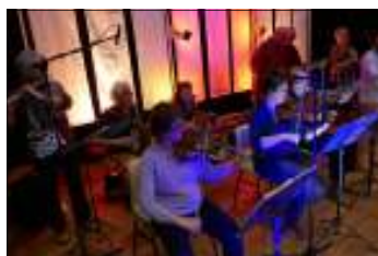
Bal de Tenay