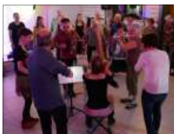
Bal de Douvres