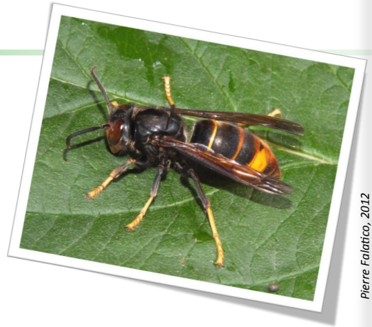
Pierre Falatico, 2012