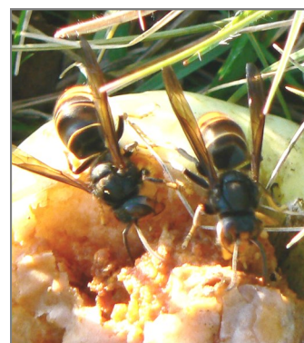
Frelon asiatique (Fredon RA, 2011)