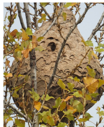
Nid de Beauchastel (Pierre Falatico, 2012)