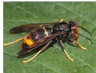
Frelon asiatique (Pierre Falatico, 2012)