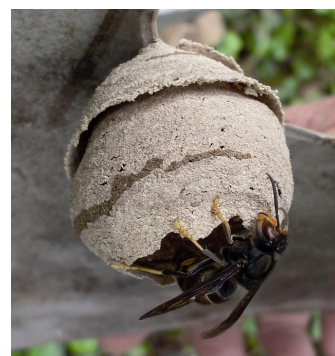
Nid primaire (Basile Naillon, 2012)