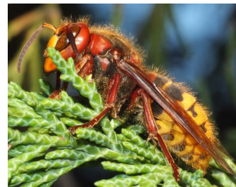
Frelon européen (Pierre Falatico, 2012)

Pour tout renseignement n'hésitez pas à nous contacter ou à consulter les différentes fiches techniques disponibles sur notre site internet.